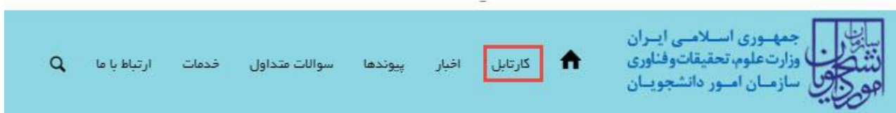
تصویر ۹- کارتابل شخصی

با دریافت پیغام جهت مراجعه به پورتال، برای مشاهده وضعیت خود اقدام نمایید. از طریق پورتال سازمان امور دانشجویان سربرگ کارتابل را انتخاب نمایید. (تصویر ۹)