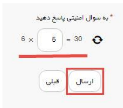
تصویر ۵- سوال امنیتی

سپس به سوال امنیتی پاسخ داده و بر روی دکمه ارسال کلیک کنید. (تصویر ۵)