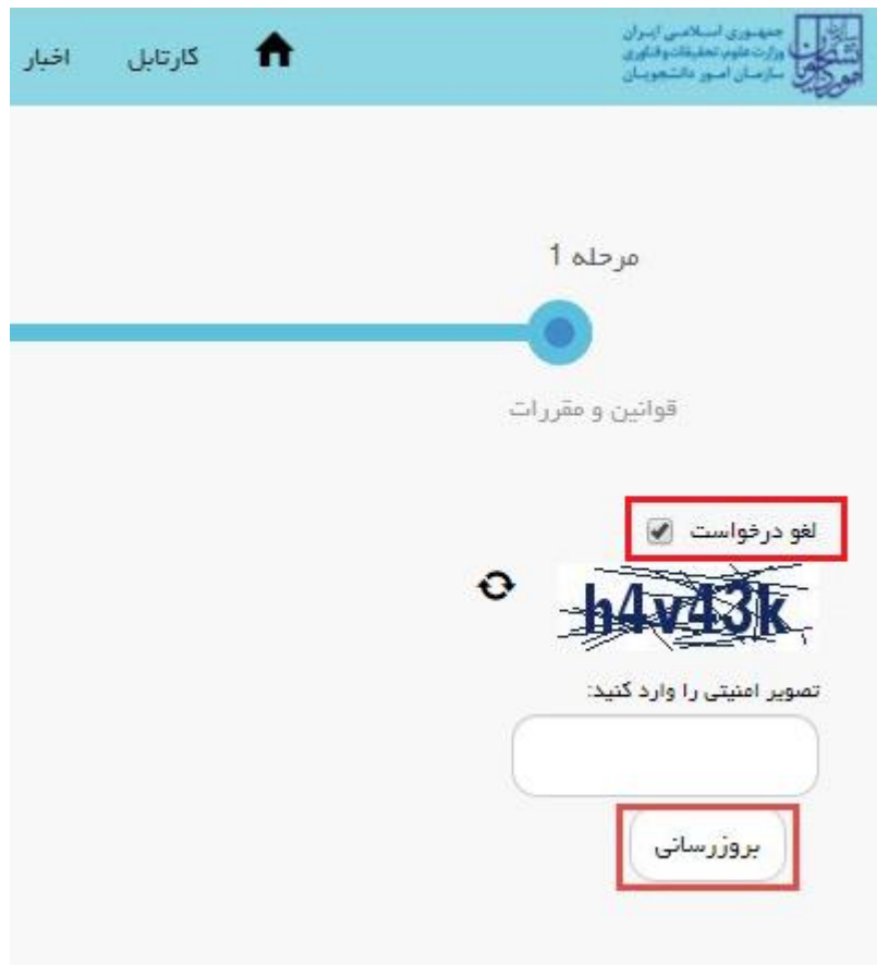
تصویر ۱۲-لغو درخواست

همچنین می توانید با انتخاب گزینه لغو درخواست نسبت به لغو فرآیند اقدام نمایید.(تصویر ۱۲)