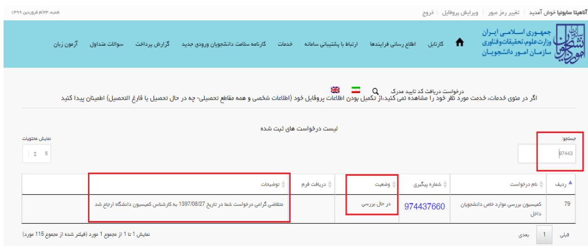
تصویر ۱۷- وضعیت ارجاع به کمیسیون

۶. در مرحله ای که کار در کارتابل کمیسیون دانشگاه قرار می گیرد پیغام زیر به متقاضی نمایش داده می شود. (تصویر ۱۷)