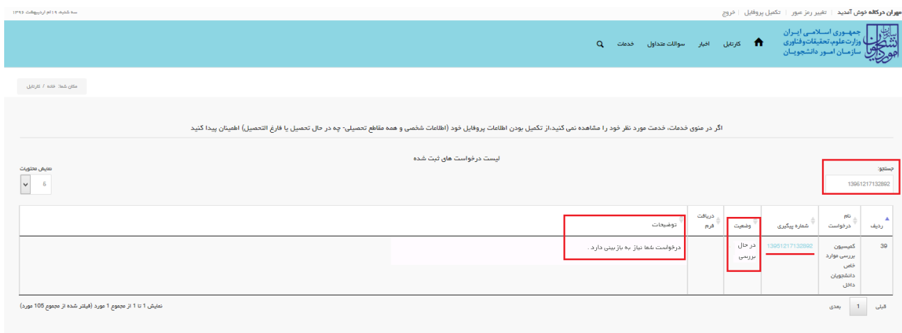
تصویر ۱۰- تکمیل اطلاعات توسط متقاضی

۱. در صورتی که کارشناس مربوطه اعلام نیاز به بازبینی نماید. (تصویر ۱۰)