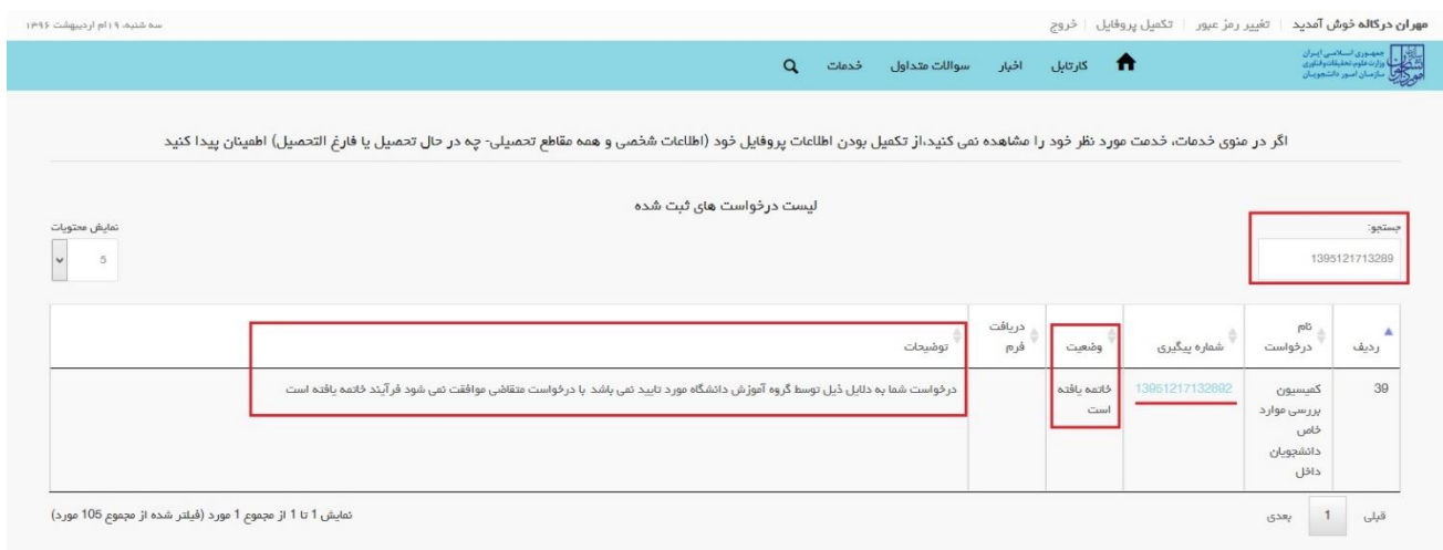
تصویر ۱۳-عدم تایید درخواست

۲. در صورتی که کارشناس آموزشی دانشگاه (در مرحله بررسی اولیه درخواست و مدارک متقاضی) اعلام عدم تایید درخواست نماید.(تصویر ۱۳)